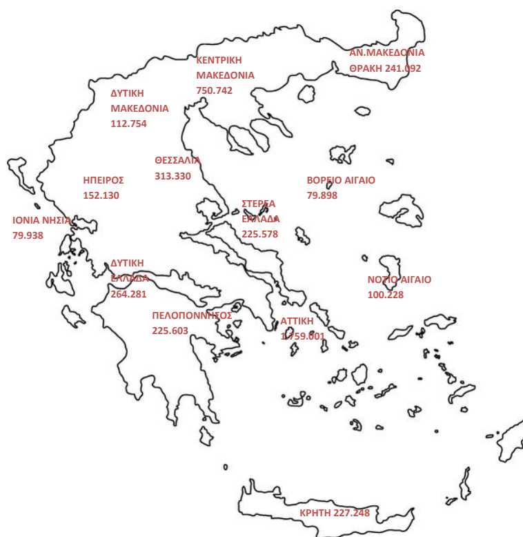
Χάρτης 1: Καταβολή Συντάξεων ανά Περιφέρεια

Στον Πίνακα 17 αποτυπώνονται τα ποσά σύνταξης που αντιστοιχούν σε κάθε Περιφέρεια σε σχέση με το αντίστοιχο ΑΕΠ για το έτος 2013 (προσωρινά στοιχεία ΕΛΣΤΑΤ). Σύμφωνα με τα δεδομένα του Πίνακα 17, στην Περιφέρεια Ηπείρου παρατηρείται η μεγαλύτερη τιμή (22,1%) του λόγου ποσού σύνταξης προς ΑΕΠ και ακολουθεί η Περιφέρεια Θεσσαλίας με τιμή 20,1%. Στην τελευταία θέση βρίσκεται η Περιφέρεια Νοτίου Αιγαίου με τιμή 10,3%.