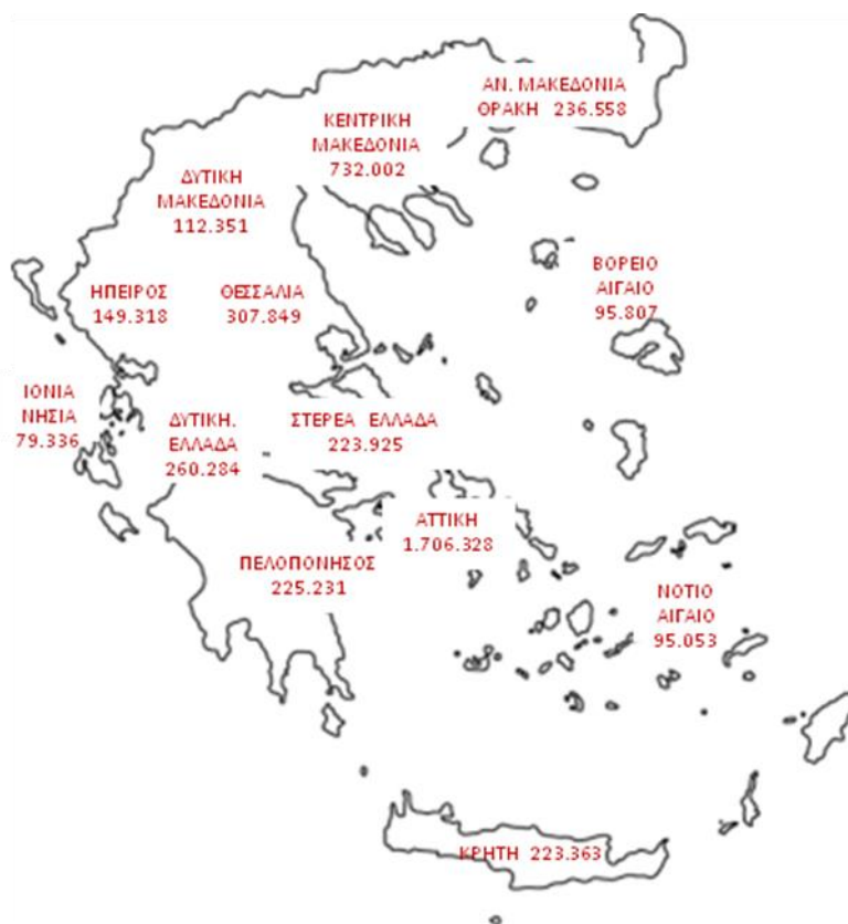
Χάρτης 1: Καταβολή Συντάξεων ανά Περιφέρεια

Στον Πίνακα 8 αποτυπώνονται τα ποσά σύνταξης που αντιστοιχούν σε κάθε Περιφέρεια σε σχέση με το αντίστοιχο ΑΕΠ για το έτος 2010 (προσωρινά στοιχεία ΕΛΣΤΑΤ). Σύμφωνα με τα δεδομένα του Πίνακα 8, στην Περιφέρεια Ηπείρου παρατηρείται η μεγαλύτερη τιμή (17,4%) του λόγου ποσού σύνταξης προς ΑΕΠ και ακολουθεί η Περιφέρεια Θεσσαλίας με τιμή 17%. Στην τελευταία θέση βρίσκεται η Περιφέρεια Νοτίου Αιγαίου με τιμή 7,7%.